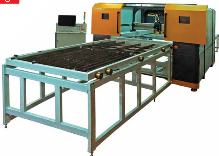
Рис. 1 Лазерная система МЛПЗ компании ЗАО НИИ ЭСТО (Россия) с высокоэффективными линейными двигателями НПЦ «Лазеры и аппаратура ТМ» (Россия) и волоконными лазерами «ИРЭ-Полус» (Россия).